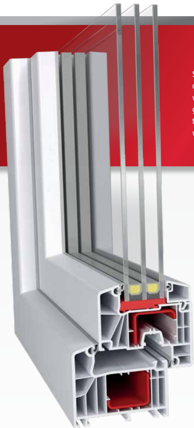
IDEAL 7000 Classic-line | 85 mm

Seria IDEAL 7000 to przykład synergicznego wykorzystania właściwości profili i szyb zespolonych w celu tworzenia okien charakteryzujących się bardzo niską przenikalnością cieplną. Uzyskany w badaniach współczynnik przenikalności cieplnej profili o wartości do U_f=1,1 W/m 2 K w połączeniu z możliwością stosowania szerszych i cieplejszych pakietów szybowych o szerokości do 51 mm gwarantuje najlepsze parametry cieplne okna.