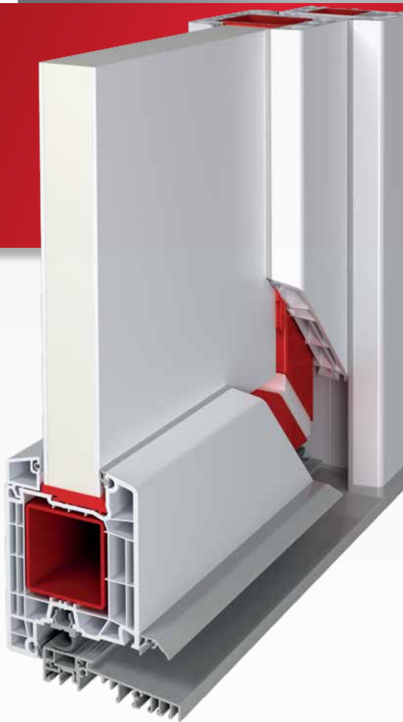
Drzwi zewnętrzne IDEAL 7000 | 85 mm